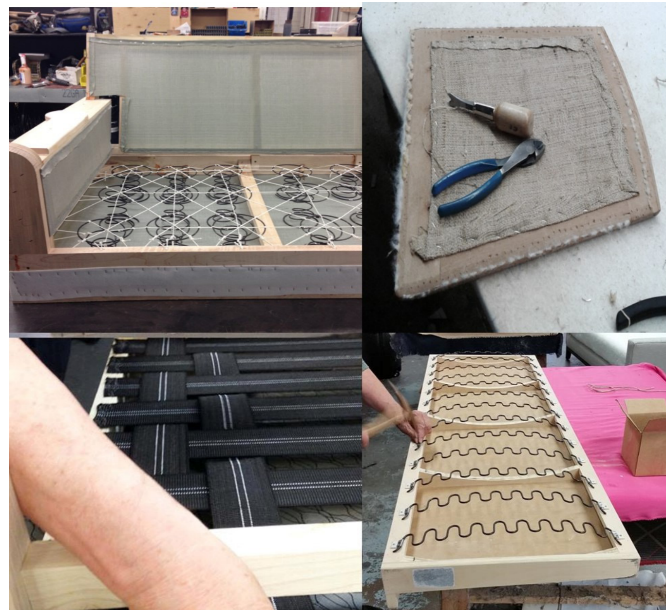
La costruzione del telaio degli imbottiti con l'integrazione tra poliuretano sagomato, legno e parti in metallo

I capitoli che seguono analizzano nel dettaglio le particolarità produttive legate a ciascun settore considerando il grado di innovazione e le dimensioni economiche legate a ciascun comparto produttivo.