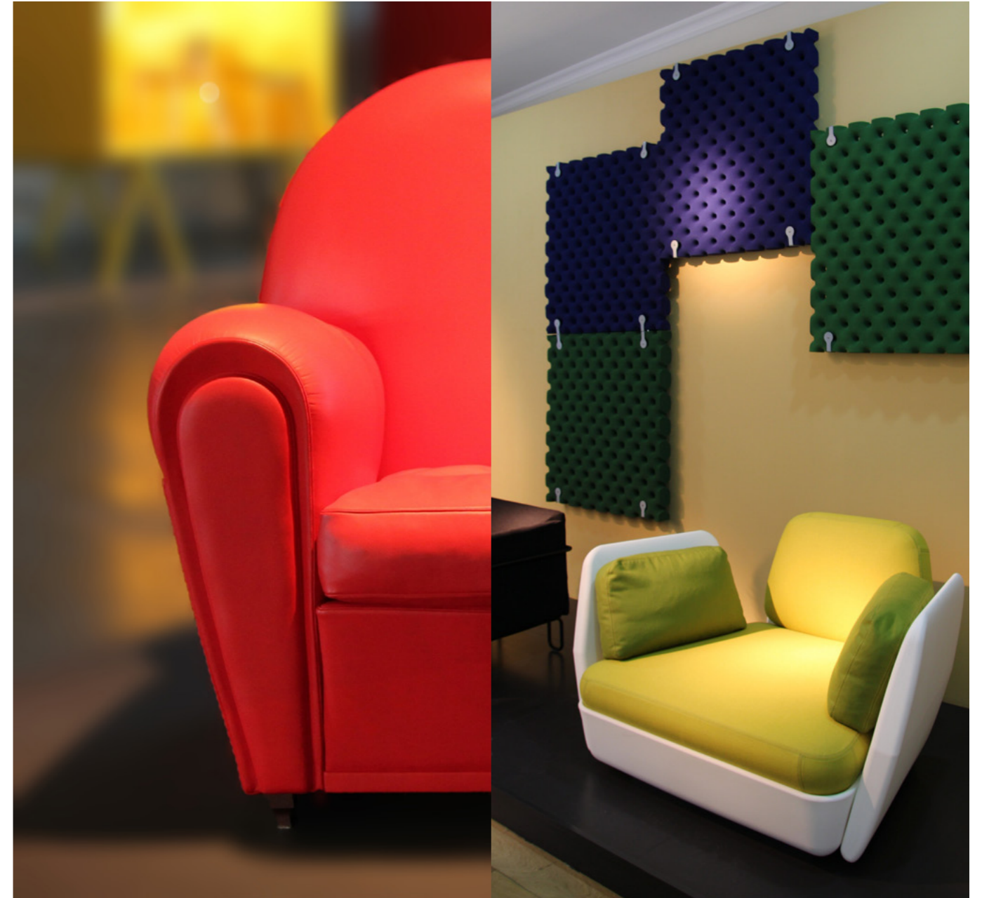
Gli spazi pubblici dove la presenza del poliuretano espanso flessibile è significativa.

Nel caso specifico del letto, inteso come sistema di arredo che comprende la struttura portante, il materasso, la rete, i rivestimenti ed i guanciali, esso deve essere scelto con cura puntando sulla qualità dei materiali, sulla durata nel tempo ed il livello di comfort. Il materasso ed il guanciaie devono offrire elevate prestazioni in termini ergonomici, abbinati ad una rete di qualità che crei un affidabile sostegno all'imbottitura. In questo senso la sensibilità generale degli alberghi, in particolare di fascia alta e posizionati in prevalenza nel nord Europa, si sta progressivamente rafforzando nella direzione di offrire al cliente un soggiorno il più possibile confortevole e personalizzabile, una sorta di "esperienza sensoriale del dormire" che si basa su una ampia offerta tipologica. La tendenza che si fa largo è quella di offrire al cliente la possibilità di scegliere tra diversi modelli di guanciali e, a volte, anche di materassi, personalizzando quindi il proprio soggiorno nell'hotel, in funzione delle proprie abitudini e attitudini consolidate. In altri casi la tendenza è quella di organizzare le camere d'albergo differenziandole in base a diverse tipologie di materassi e cuscini, in modo da offrire un ampio range di possibilità al cliente finale.