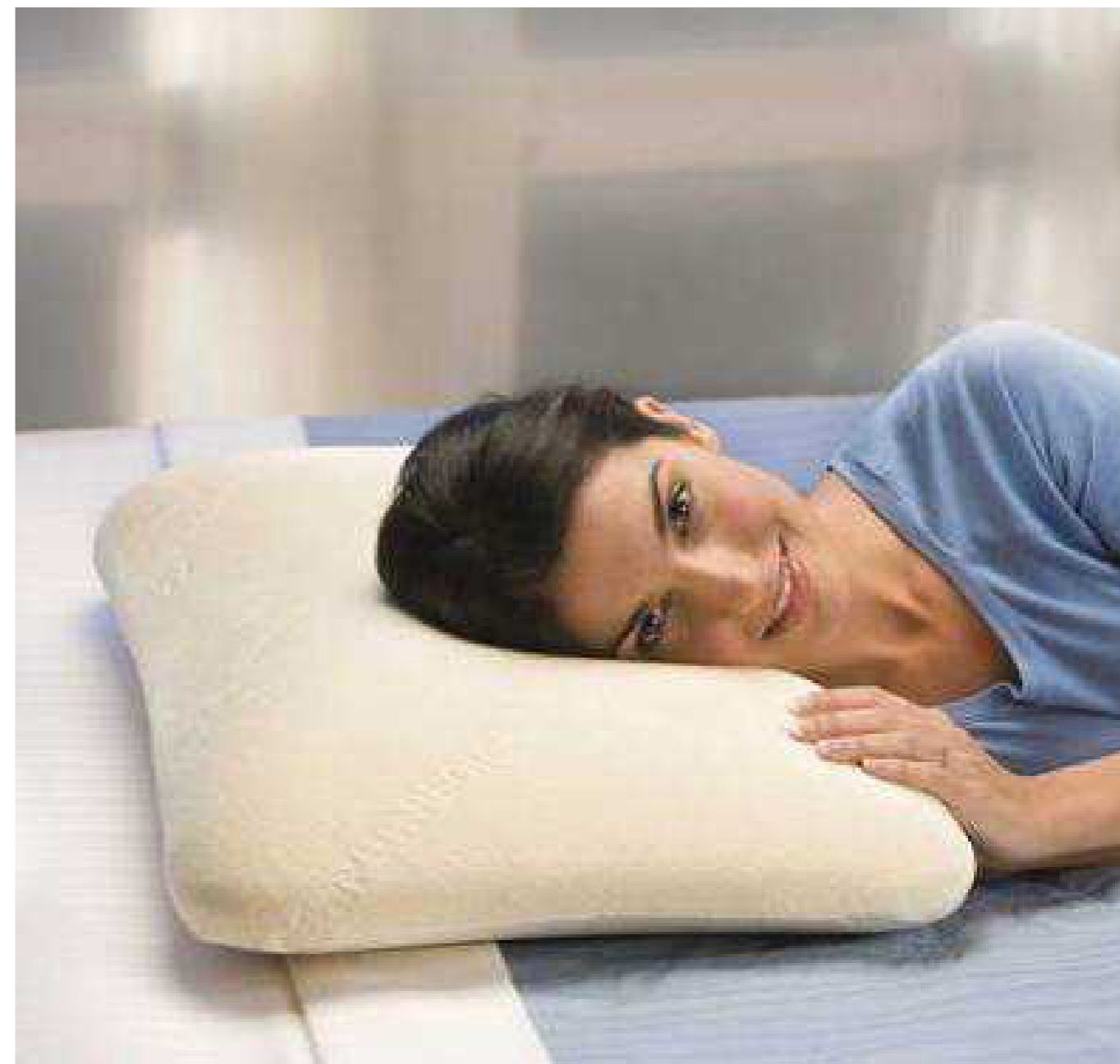
Lo spessore del guanciaie è in relazione alle diverse abitudini con le quali ci si distende a letto

Esiste poi il guanciaie medio, con spessore di circa 12-13 cm, che costituisce il supporto ideale per chi dorme supino, e dovrebbe essere mediamente duro. In questi casi la colonna cervicale non si può giovare della rigidità della superficie del materasso poiché si trova "sospesa" con l'occipite.